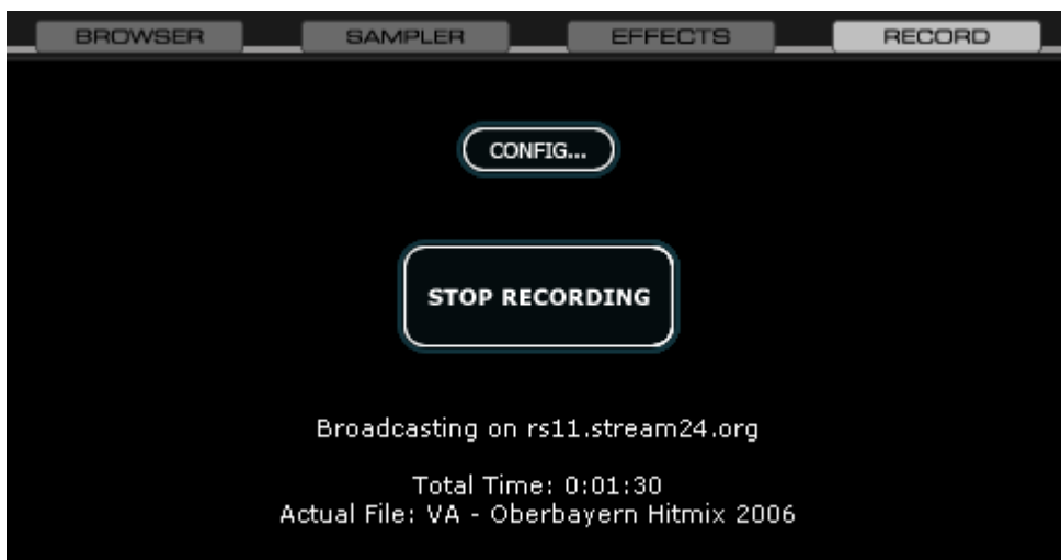
Fig. 6 VirtualDJ Broadcast (recorte)

Dado el caso que la conexión con el servidor streaming haya tenido éxito, podrá ver que el contador empieza contando la duración de la transmisión y los datos transmitidos.