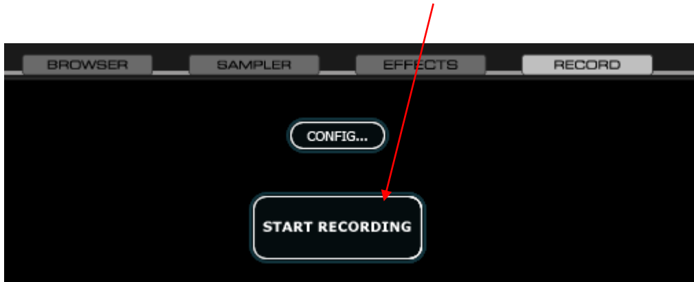
Fig. 5 VirtualDJ Record Start (recorte)

Pulse en el botón [START RECORDING] para iniciar la transmisión del stream.